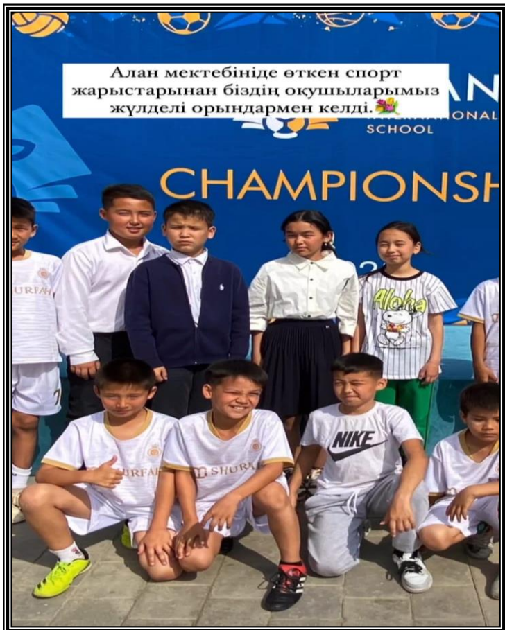
ДИРЕКТОРДЫҢ ТӘРБИЕ ІСІ ЖӨНІНДЕГІ ОРЫНБАСАРЫ